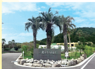
「飯塚スポーツ・リゾートTHE Retreat」2020年4月開業(旧筑豊ハイツ)

※ 以上の実績は多くの関係者の理解・協力・努力のもと実現できたものですが、その発案や要望継続などで私がしっかりと尽力できたものについて掲載しました。